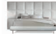
Class Square 132-135