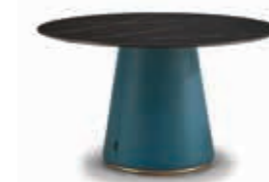
Tavoli e Sedie 164-166