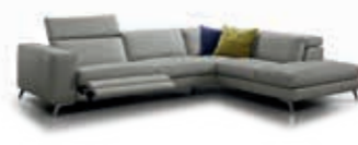
Infinity M 110-115