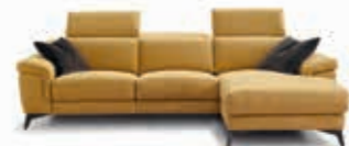
Infinity A 116-119